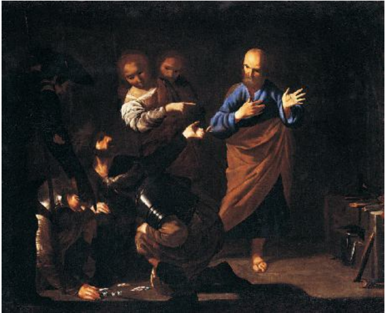
Bernardo Cavallino, Negazione di Pietro , Napoli, collezione privata