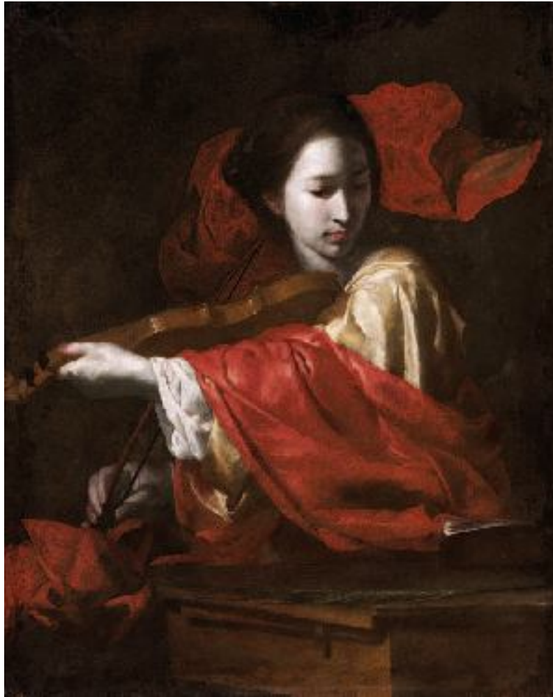
Bernardo Cavallino, Santa Cecilia , Boston, The Museum of Fine Arts