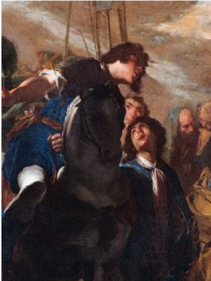
Bernardo Cavallino, Incontro di San Pietro e San Paolo sulla via Ostiense , Roma, Palazzo Barberini, Galleria Nazionale d'Arte Antica (particolare)