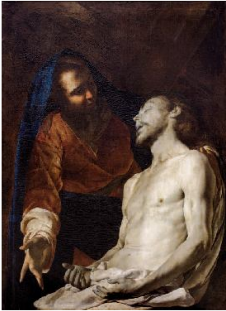
Bernardo Cavallino, Pietà , Molfetta, Pinacoteca del Seminario Arcivescovile