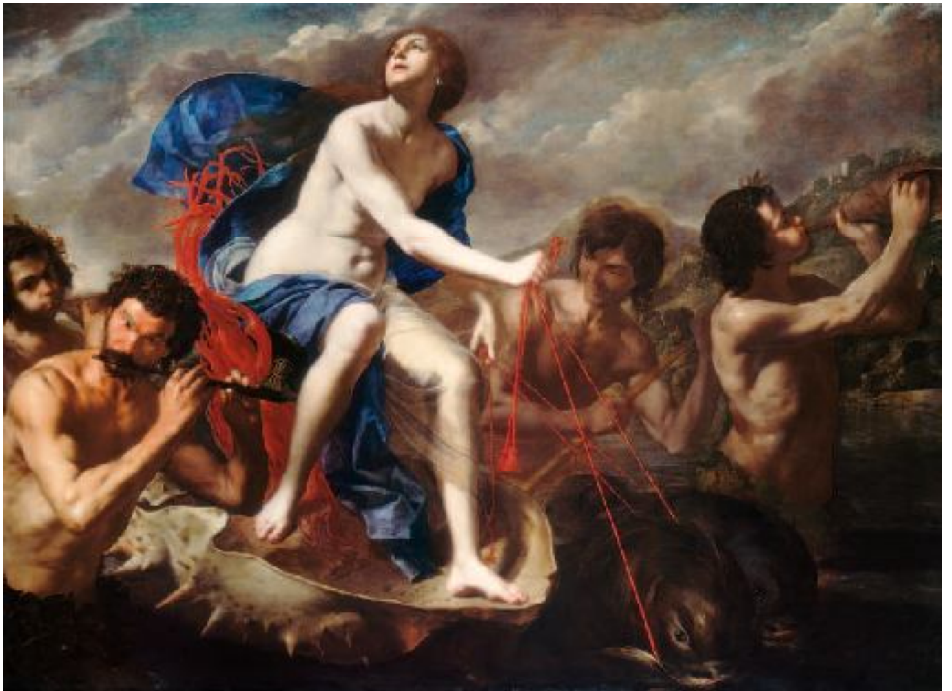
Bernardo Cavallino, Trionfo di Asfide , Washington, The National Gallery of Art