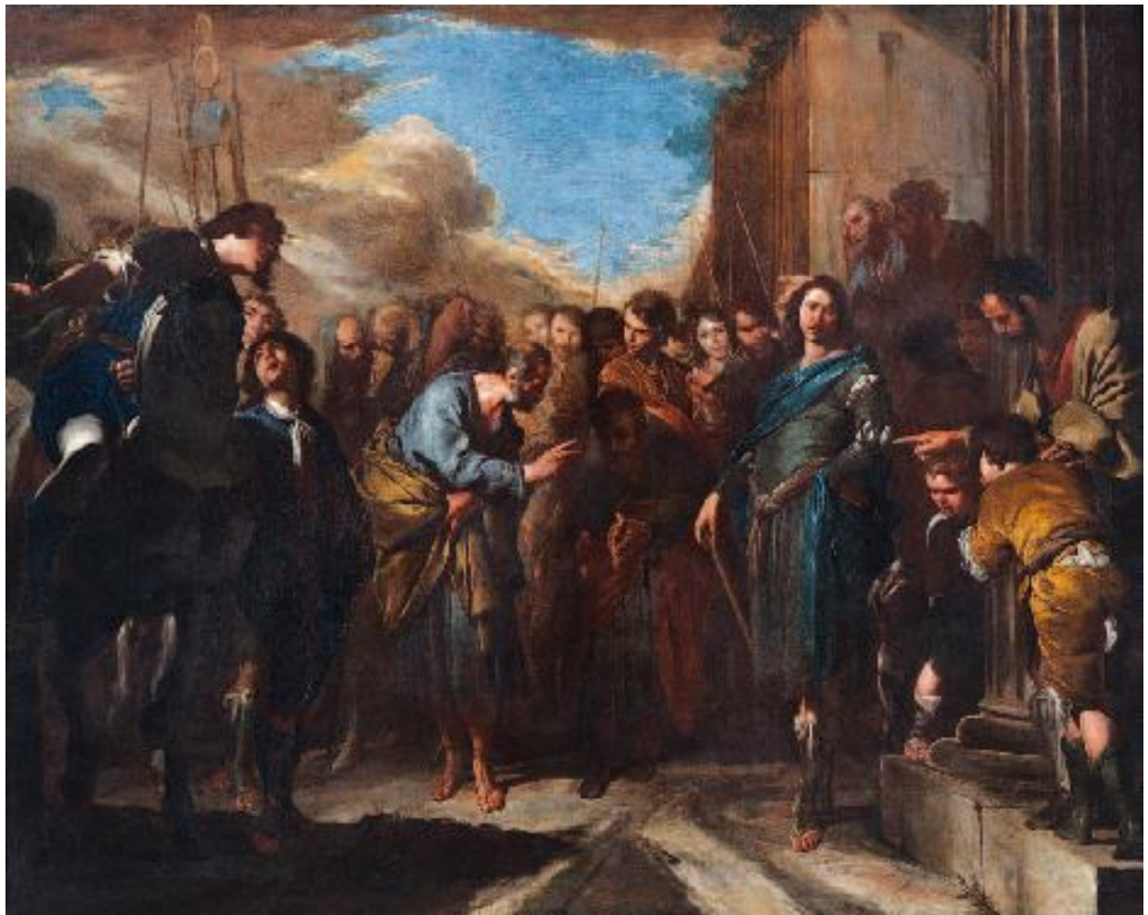
Bernardo Cavallino, Incontro di San Pietro e San Paolo sulla via Ostiense , Roma, Palazzo Barberini, Galleria Nazionale d'Arte Antica