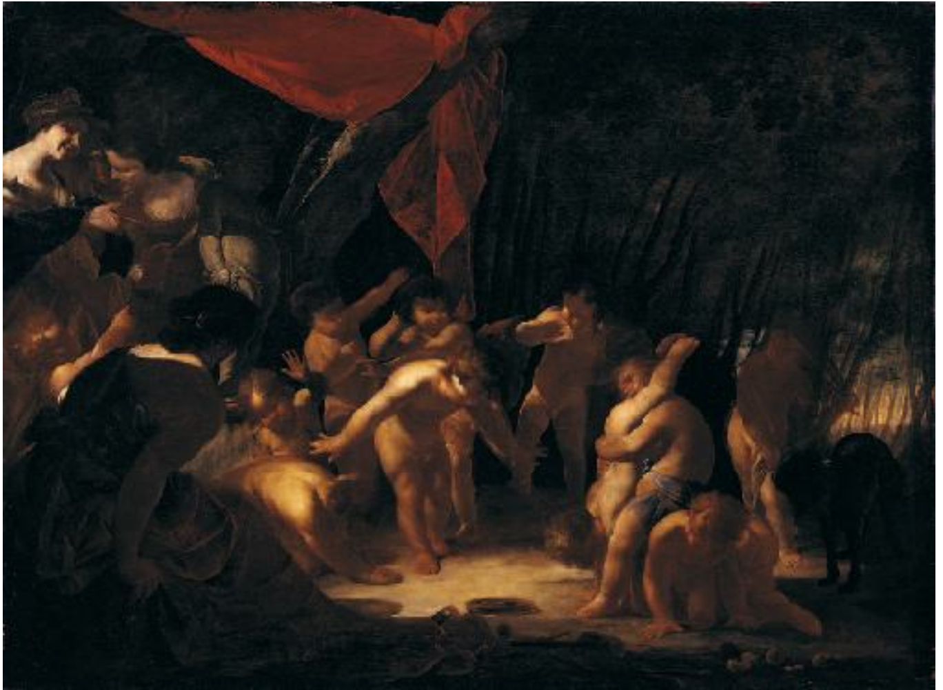
Bernardo Cavallino, Giochi di putti dinanzi alla statua di Bacco bambino , Napoli, Museo di Capodimonte