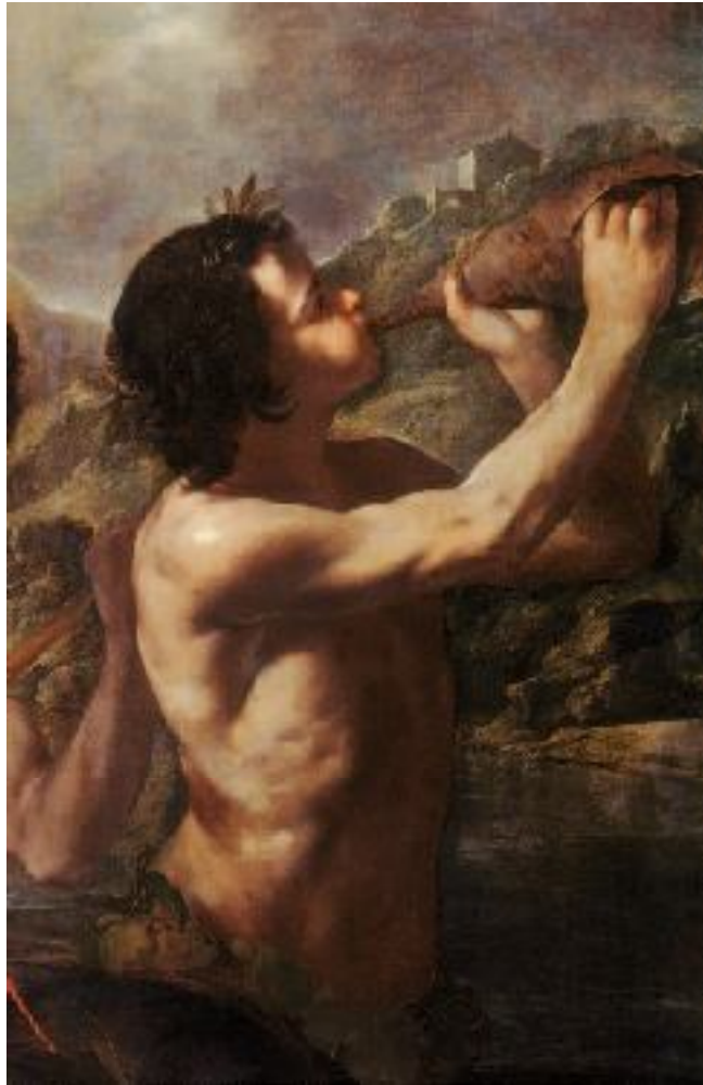
Bernardo Cavallino, Trionfo di Anfite , Washington, The National Gallery of Art (particolare)