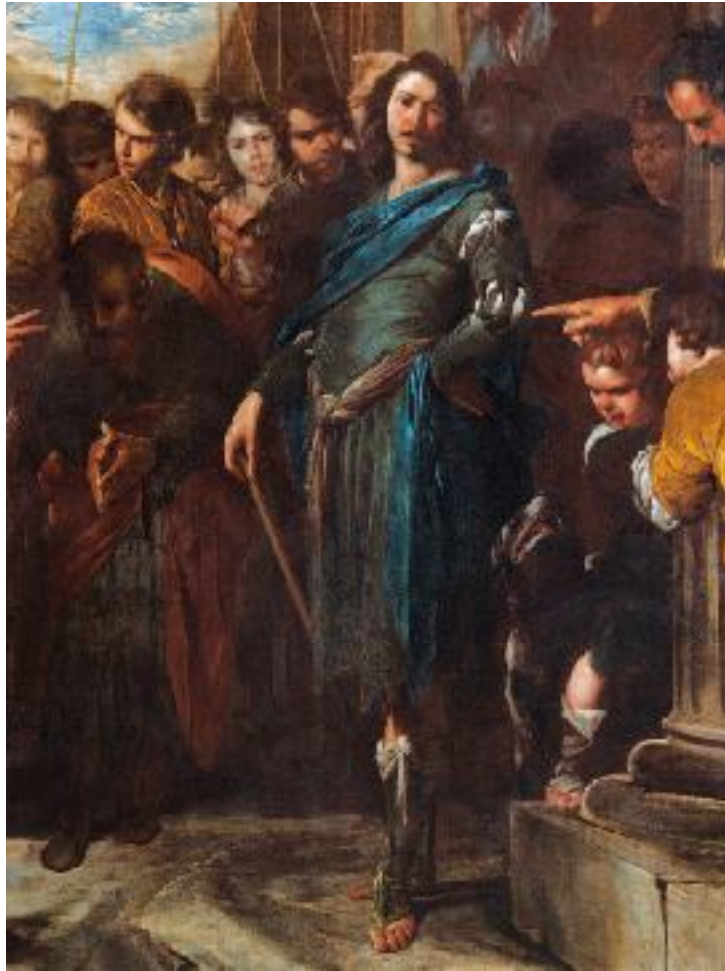
Bernardo Cavallino, Incontro di San Pietro e San Paolo sulla via Ostiense , Roma, Palazzo Barberini, Galleria Nazionale d'Arte Antica (particolare)