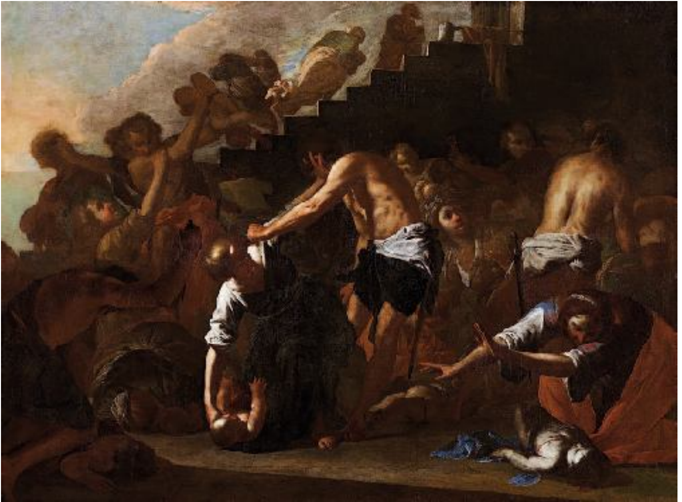
Bernardo Cavallino, Strage degli innocenti , Milano, Pinacoteca di Brera