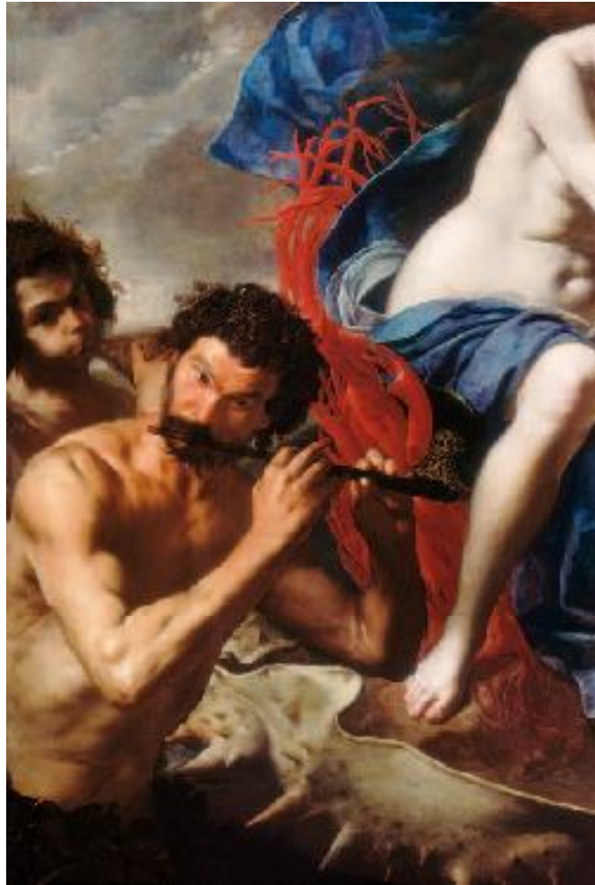
Bernardo Cavallino, Trionfo di Anfite , Washington, The National Gallery of Art (particolare)