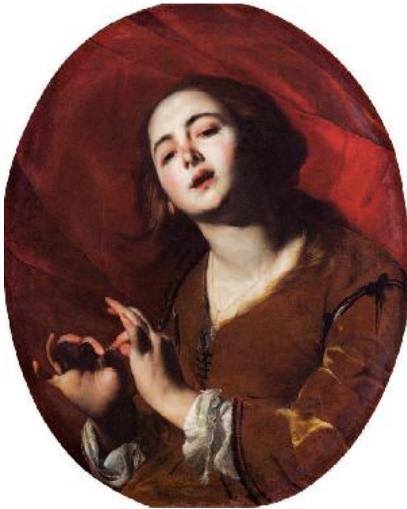
Bernardo Cavallino, La cantatrice , Napoli, Museo di Capodimonte