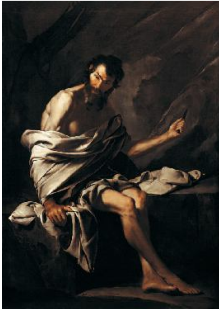
Bernardo Cavallino, San Bartolomeo , New York, collezione privata