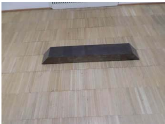
Richard Nonas The Venus on the South gennaio 1956 Steel cm.12x129x17

Giuseppe Panza di Biumo che acquistava e vendeva le sue opere continuando a avere una raccolta in movimento, avrebbe amato metterle a disposizione di un museo dedicato alla sua collezione. Questo non è avvenuto probabilmente perché i tempi in Italia non erano ancora maturi. Il collezionista nel 1994 ha dato in comodato al FAI Villa Menafoglio Litta Panza di Varese che contiene parte della collezione.