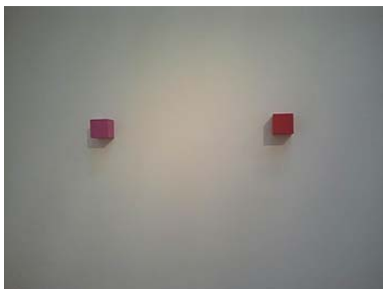
Stuart Arends SAO75 e 73 OS.No8,1993 e O.S.No 10 1993 Oil on steel cm.8,9x8,9x8,9

Panza di Biumo ha iniziato la sua importantissima collezione d'arte contemporanea negli anni '50 del Novecento, mettendo in essere una raccolta con una lungimiranza e una previsione su come alcuni artisti sarebbero divenuti importanti.