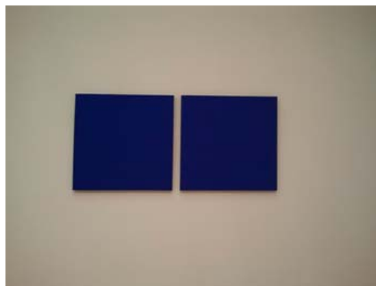
Lies Kraal Untitled n.3 1991 Technique pigment on canvas 2 panels cm.47,3x48x2,3

Dal 1966 al 1976 Panza di Biumo si interessò all'arte minimal, al concettuale e all'ambientale . Per questo in mostra c'è l'opera di Joseph Kosuth e quella ambientale dello scultore Richard Nonas . Dal 1987 al 2010 con lo sviluppo del contemporaneo la collezione si dirige verso l'arte organica, quella dei piccoli oggetti e l'arte monocroma .