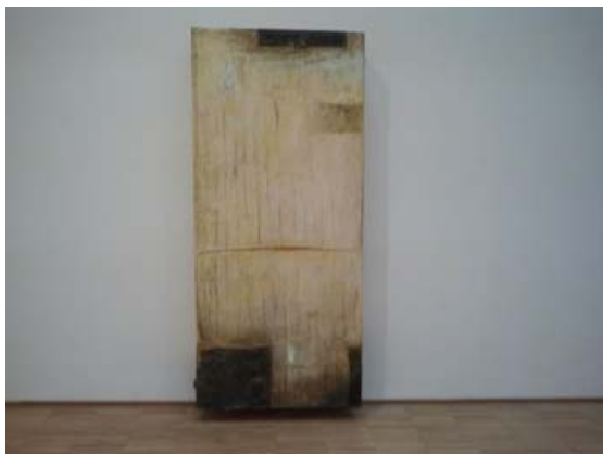
Lawrence Carroll CAR044 Buoy 1987-88 Oil, wax, rubber, canvas over wood cm.221x96,5x30,5

In questo modo i vari periodi della collezione possono essere osservati dal grande pubblico. Certamente l'intera collezione si rivolge maggiormente agli artisti americani, anche se poi nell'ultimo periodo ci sono anche artisti italiani.