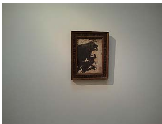
Yves Klein Drawing 1957 Oil on paper cm.28x20

Al terzo piano dell'Accademia si è pensato di mostrare 10 opere che provengono dalla Panza Collection di Lugano . Sono rappresentative dei vari periodi dell'importante collezione che il collezionista ha realizzato con sua moglie dagli anni '50 del Novecento fino al 2000.